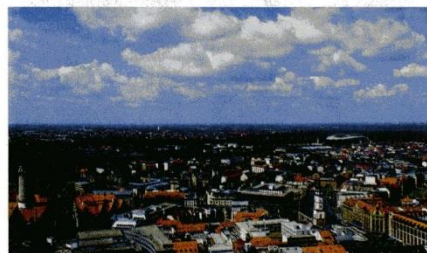
Geschichte und Moderne liegen in Leipzig dicht beieinander.

„Mein Leipzig lob' ich mir!“, sagte kein Geringerer als Johann Wolfgang von Goethe und widmete der Stadt einen Platz in seinem Lebenswerk „Faust“. Eine der Faust-Szenen spielt in Auerbachs Keller, einem Restaurant neun Meter tief unter dem Stadtpflaster. Goethe besuchte Auerbachs Kellers oft und gerne. Ihn inspirierten schließlich die Bilder der Geschichte des Kellers zur Faustdichtung. Auch Schiller war zu Gast in Leipzig. Mehrere Monate bezog Friedrich Schiller sein Sommerquartier in der Stadt. Im Schillerhaus lebte und wirkte der Dichter. Heute ist das Haus ein Museum und kann besichtigt werden.