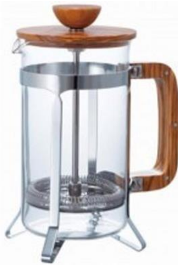
"O. W. "

4 Die Angebotsseiten der Beklagten waren wie folgt gestaltet: